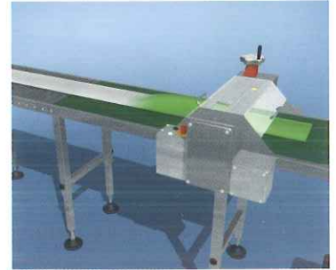
Liner auf Wandstärke walzen