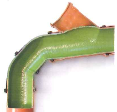
Optimale Anpassung selbst bei 90°-Bögen und Dimensionsänderungen