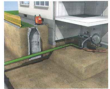
Nach dem Aushärten ist ein neues Rohr im Altrohr entstanden.