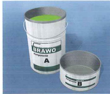
Harz und Härter mischen

Das Ergebnis ist ein komplett neues, dichtes Rohr im Altrohr mit deutlich besseren statischen Eigenschaften.