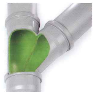
Anschluss-Stutzen und Zuläufe perfekt einbinden