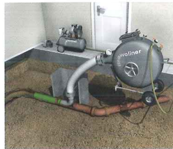
Inversion mit Drucktrommel